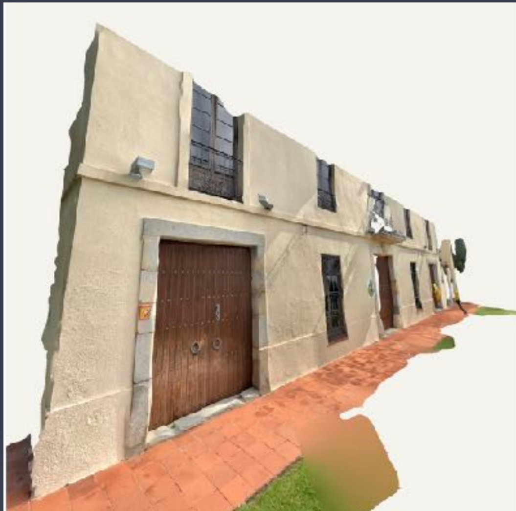
Escáner 3D parcial realizado con sensor de profundidad lidar y Drone

Hemos realizado escáner de la fachada con técnica "fotogrametría aérea con Drone" y barrido con sensor de profundidad lidar, con el que realizaremos un modelo 3D del edificio a proyectar exacto al original. Este modelo 3D se utilizará para la creación de los efectos tridimensionales de construcción, deconstrucción, texturización, lumínicos, animación 2D y 3D, etc.